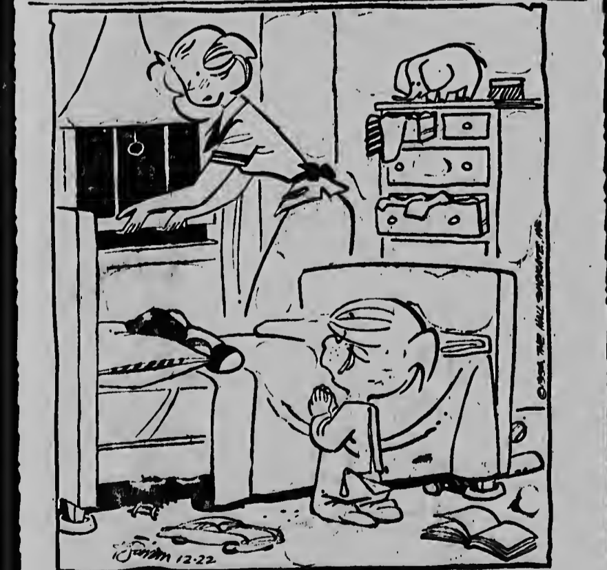
Doc het raam maar niet open. Ik heb God juist gesmeekt om anweer.

No abri e bentana, pasobra m'a cabi di reza pidi Dios pa tempestad.